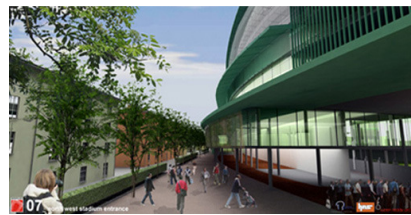
Fondove hiše na Koroški ulici tik pod novim objektom