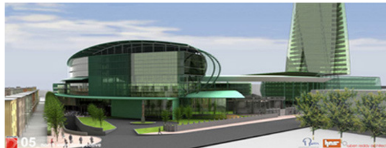
Hotel na vogalu Vodovodne ceste in Koroške ulice ter uvoz v podzemne garaže tudi za tovornjake!