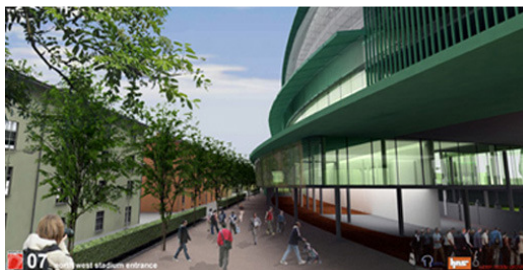
Fondove hiše na Koroški ulici tik pod novim objektom