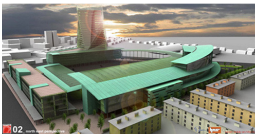
Projekt novega stadiona

Čeprav so bili vrtički ob stadionu nekoč sestavni del Fondovega naselja, jih nočemo obdržati za vsako ceno!